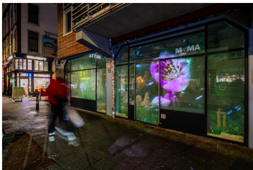
Hologram tijdens 'Arriving Not Yet' door Jinxiao Zhou

Aan de hand van de herkomst van onze online volgers (Facebook en Instagram) kunnen we aflezen dat onze activiteiten ook ver voorbij de stadsgrenzen worden gevolgd. Een meerderheid van 70% van onze volgers bevindt zich in Nederland en 30% is internationaal. Gemiddeld 25% van onze volgers zijn Rotterdams.