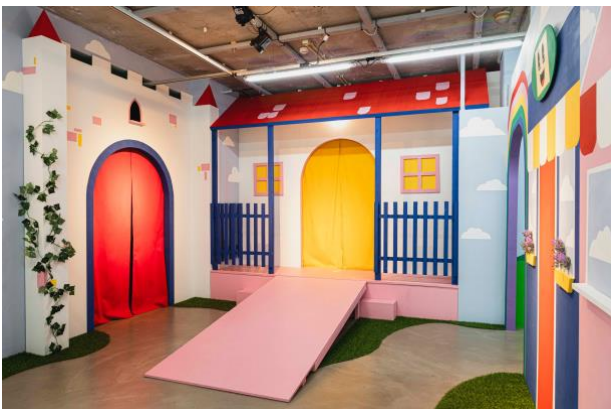
'Portal Park'