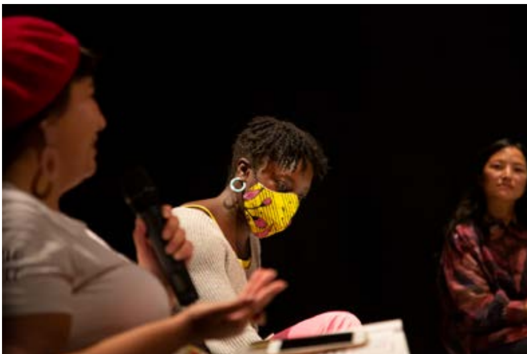
On Collective Care & Togetherness - Opening.

In 2020 zijn er nauwelijks gegevens verzameld voor het Whize/Mosaic onderzoek. Zowel het vertrek van ons contactpersoon daar als de pandemie heeft daar aan bijgedragen.